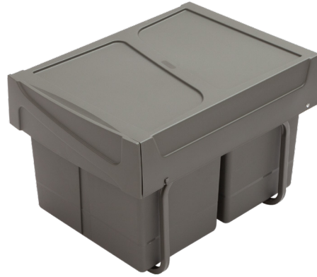
Pull-out system / 15+15 lt

Dumpster M40 disponibile nella versione 15+15 litri. Sistema manuale ad estrazione frontale, cestini facilmente removibili per lo svuotamento e la pulizia. Configurazione adatta per gestire spazi ridotti in altezza.